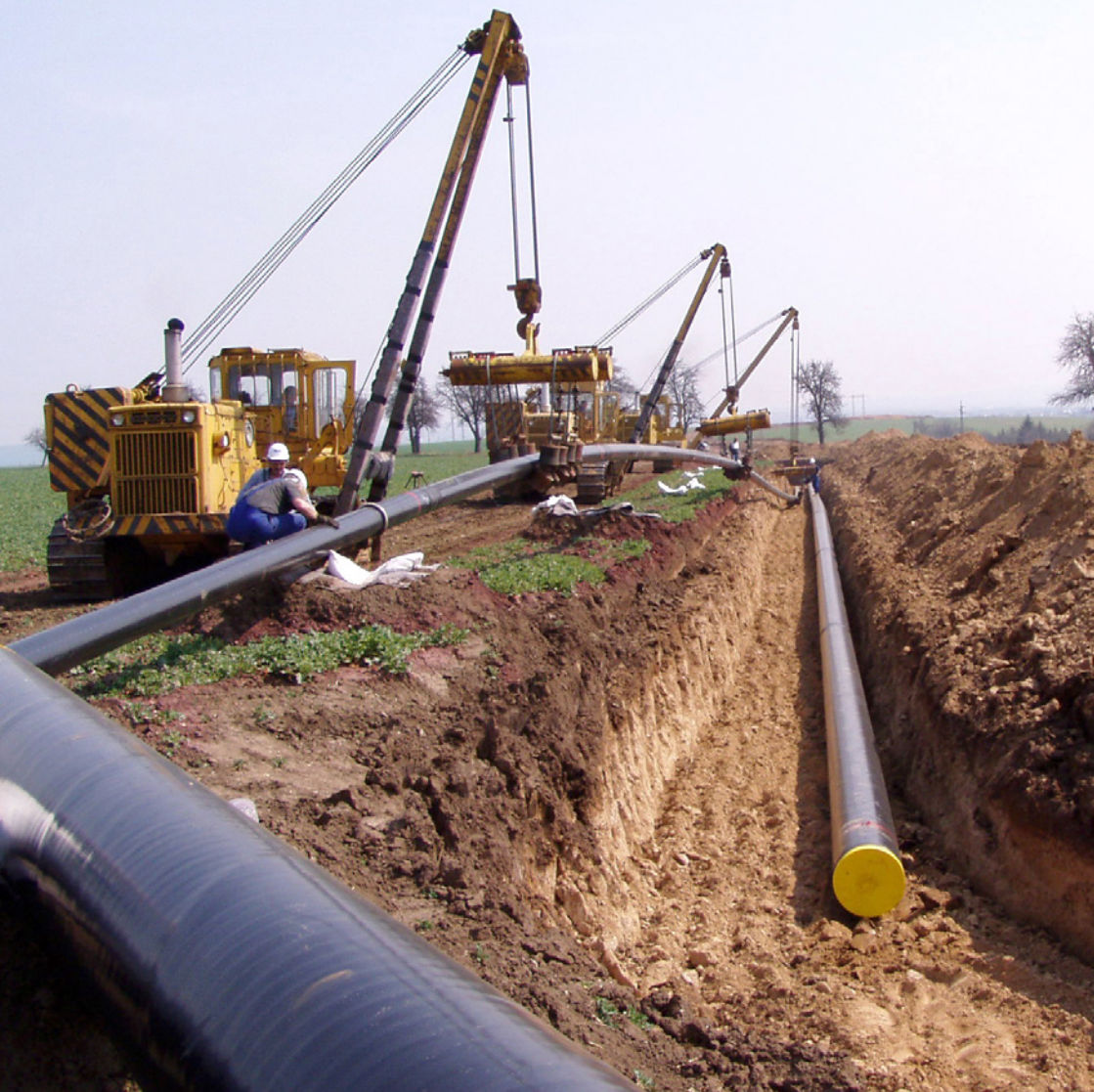
Ropovod Družba – výstavba obchvatu Kolína

Ropovody jsou obvykle uloženy v hloubce 1–1,5 metru, jen pouze cca 1 % leží na pilířích a patkách nad úroveň země, v místech s nestabilním geologickým podložím ve vytěžené uhelné pánvi u Mostu a v CHKO lužních lesů u Hodonína.