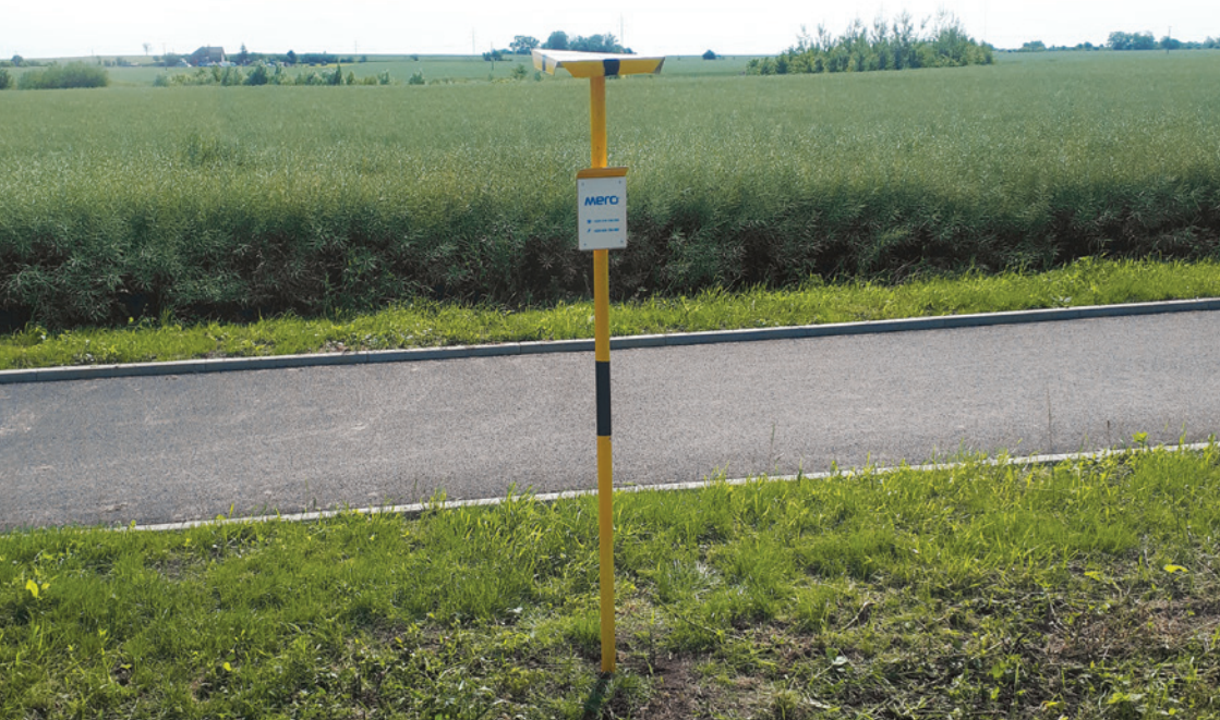
Ropovod je v terénu vyznačen orientačními body

Provozní celky ropovodu jsou rozděleny uzavíracími armaturami, které slouží k předělení ropovodu např. při opravě potrubí či případném úniku ropy.