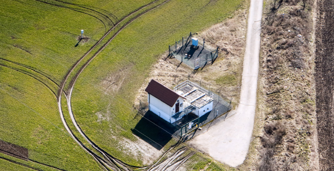
Armaturní šachta – uzávěra ropovodu vybudovaná na trase vždy po několika kilometrech

Provozní celky ropovodu jsou rozděleny uzavíracími armaturami, které slouží k předělení ropovodu např. při opravě potrubí či případném úniku ropy.